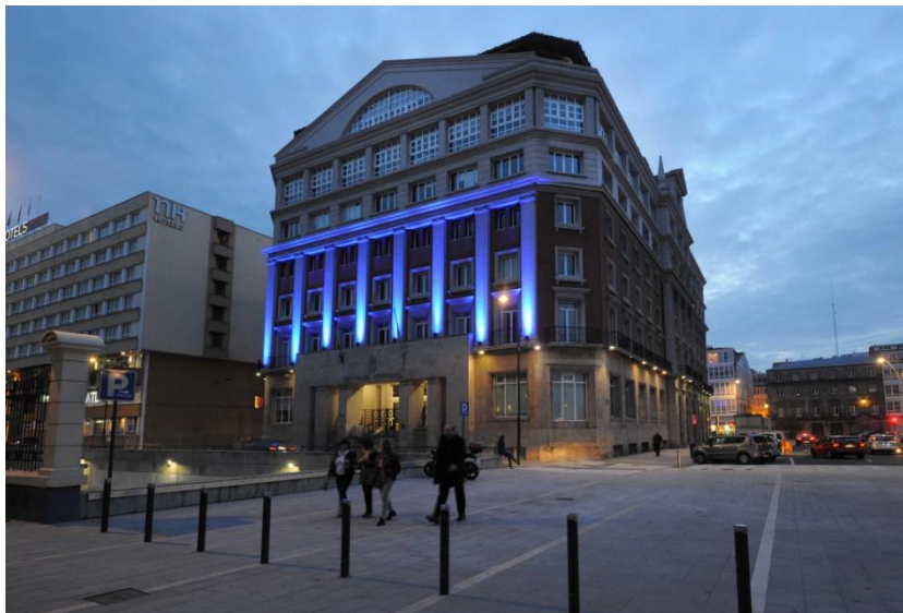
Sede actual do Pazo Provincial, reforma no 1988 o “Hotel Embajador“ edificado en 1948.

O franquismo amplía a rede de órganos da administración periférica. A Comisión Provincial de Servizos Técnicos, nacida inicialmente nas deputacións, se estatalizará progresivamente, subordinándose aos gobernos civís. Tras a última paréntese franquista, queda atrás o estigma da división territorial para a execución de actividades propias do Estado.