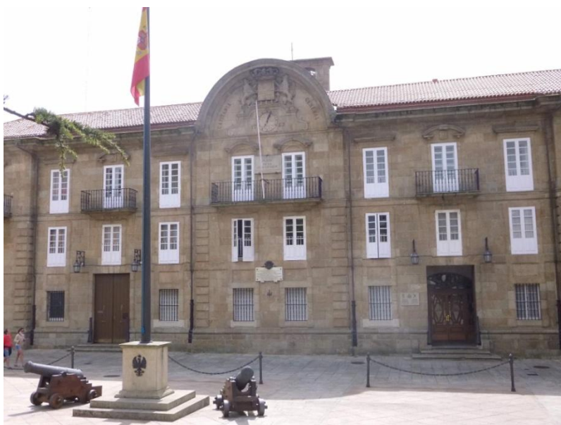
Pazo de Capitanía, século XVIII, avance do Neoclasicismo en Galicia.

A lei fundamental de deputacións do ministerio progresista de Mendizábal, do 25 de setembro de 1835, toma como modelo as ordenanzas de trienio liberal inspiradas na Constitución de 1812. As deputacións tiñan, entre outras, as atribucións de sinalar e distribuír contribucións estatais, repartir os gastos orzamentarios, recrutar mozos do exército, examinar as contas dos pobos, os seus orzamentos e calibrar os seus imprevistos, fornecer censos de estatísticas ao goberno, soste as milicias nacionais, administrar os servizos de bagaxes, promover a instrución pública e a beneficencia 2 .