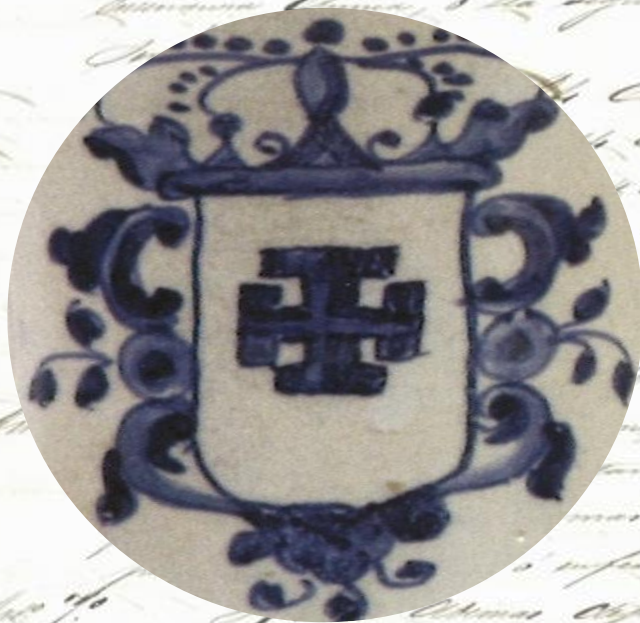
Albarelos da Farmacia do Hospital Real (1785), detalle. Museo do Pobo Galego. Depósito Deputación Provincial da Coruña